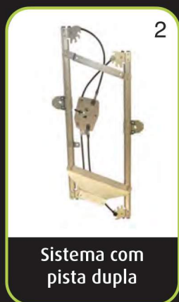
Sistema com pista dupla