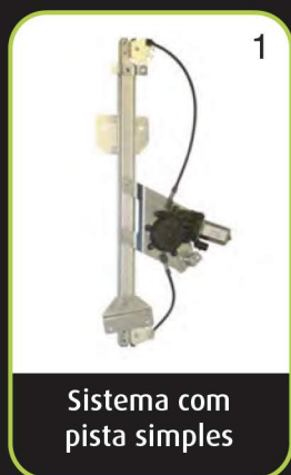
Sistema com pista simples

A gama Valeo de Elevadores de Vidros cobre às quatro tecnologias existentes no mercado