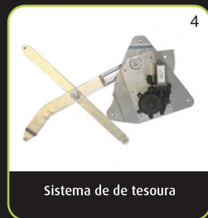
Sistema de tesoura

2,4 milhões de caminhões do Parque Europeia abrangidos pela gama Valeo com 45 referências