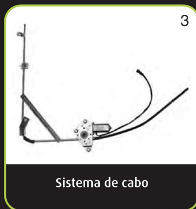
Sistema de cabo