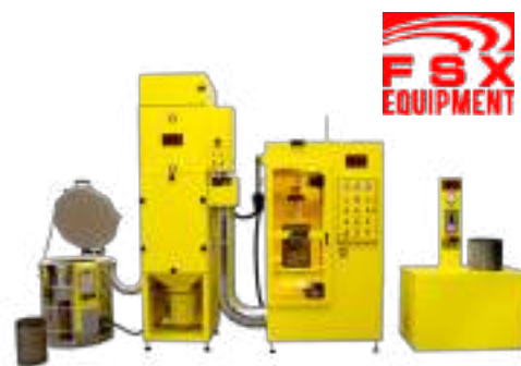
Passo 1 e 2

O processo FSX e o equipamento são aprovados e utilizados pelos fabricantes OE.